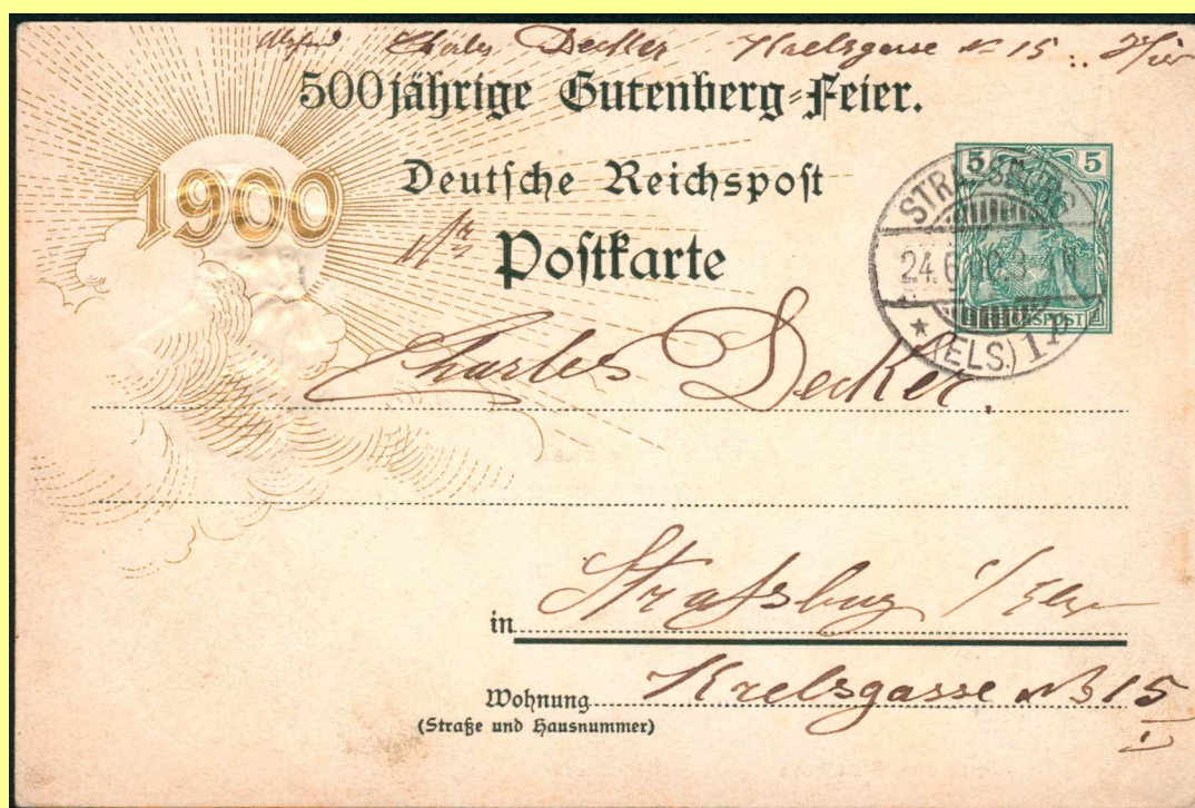
Carte postale locale de Strasbourg du 24 juin 1900.

L'encyclopédie nous apprend que Johannes GENSFLEISCH, dit GUTENBERG est né entre 1394 et 1399 à Mayence et qu'il y est décédé en 1468. Il s'était établi à Strasbourg en 1434. Il s'intéressa d'abord à la taille des pierres précieuses, puis à la fabrication des miroirs en 1437. Dès 1438, il travaille à une technique entourée du plus rigoureux secret, mais que l'on peut identifier avec le procédé d'imprimerie en caractères mobiles. C'est en effet vers 1440 que des témoignages font remonter la découverte de la typographie par Gutenberg.