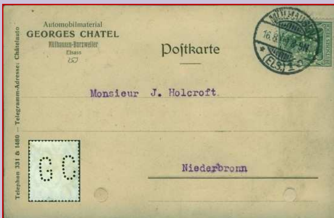
Perforation GC (N° ANCOPER GC 59). Georges Chatel Automobilmaterial, Mülhausen-Burzweiler Elsass. Carte commerciale de Mulhouse Haut-Rhin du 16 août 1909. Taxe 5 Pfennig selon tarif en vigueur du 01.07.1906 pour régime intérieur.