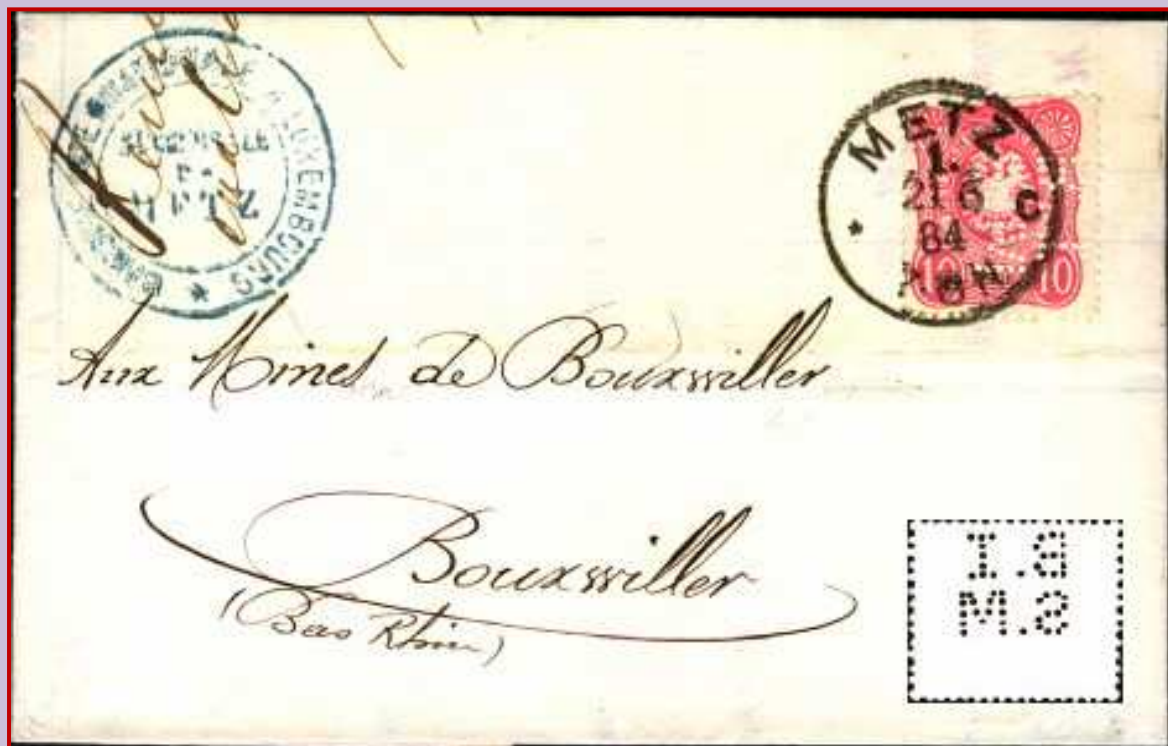
Perforation B.I/S.M (N° ANCOPER B.I/SM 19). Banque Internationale A. Luxembourg, succursale de Metz. Lettre de Metz Moselle du 21 juin 1884. Taxe 10 Pfennig selon tarif en vigueur du 01.04.1900 pour le régime extérieur.