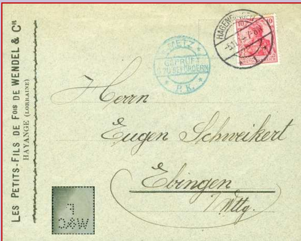
Perforation F/W&C (N° ANCOPER F/W&C 57). Les Petits-Fils de François de Wendel & Cie., Hayange (Lorraine). Lettre de Hayange Lorraine du 5 novembre 1914. Taxe 10 Pfennig selon tarif en vigueur du 01.07.1906 pour régime intérieur. Cachet de contrôle du courrier "Cachet à deux cercles et à pont". Type 2c selon catalogue SPAL.