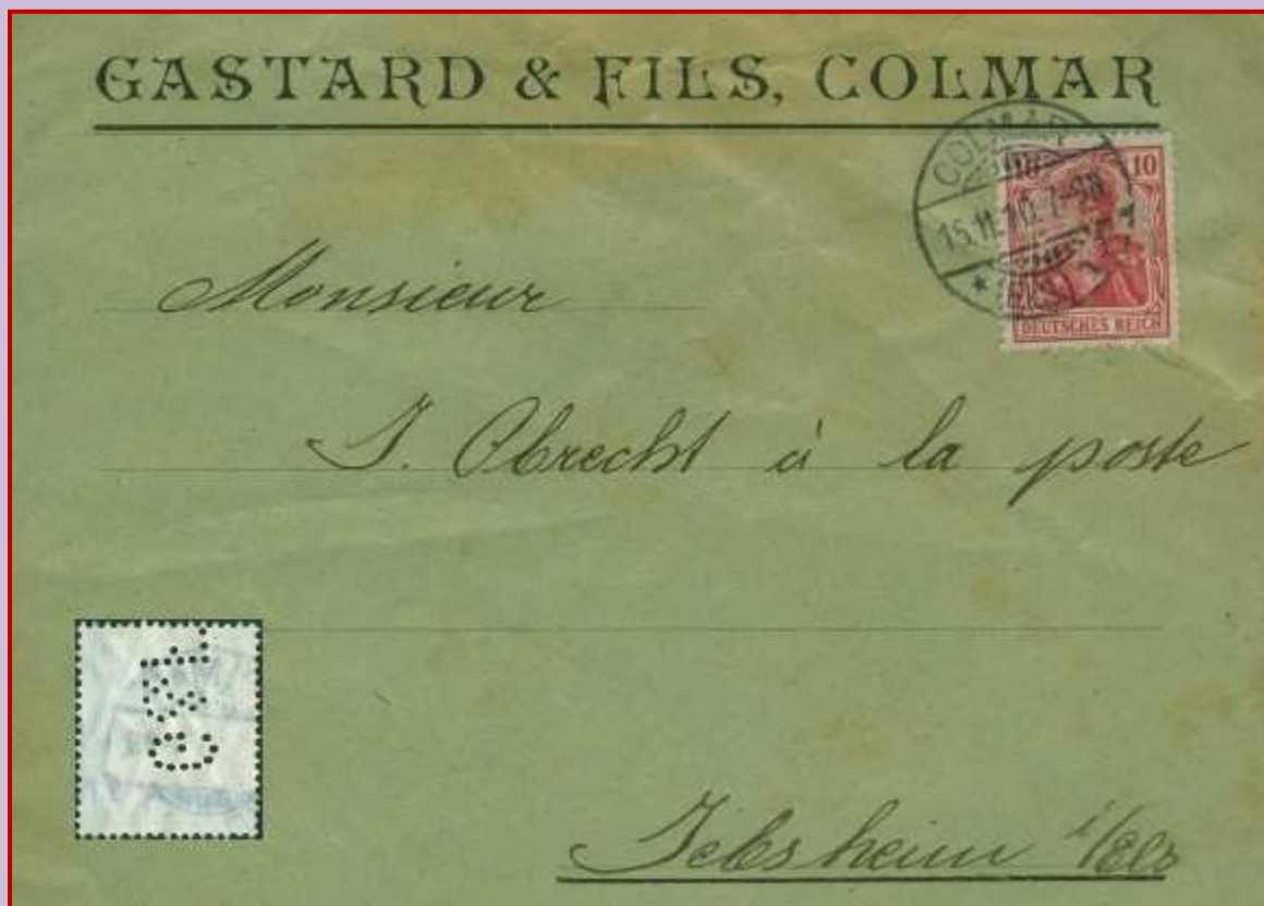
Perforation G&F (N° ANCOPER G&F 62). Gastard & Fils Colmar i. Elsass. Lettre de Colmar Haut-Rhin du 15 novembre 1910. Taxe 10 Pfennig selon tarif en vigueur du 01.07.1906 pour régime intérieur. Perforation utilisée de 1910 à 1912.