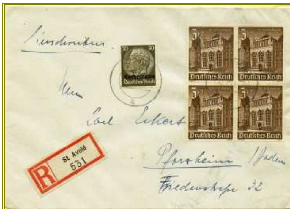
Lettre d'un fonctionnaire de Saint-Avold du 22 février 1941 pour Pforzheim, affranchie avec un 30 pf. au type Lothringen et un bloc de quatre du 3 pf. de l'œuvre du secours d'hiver.