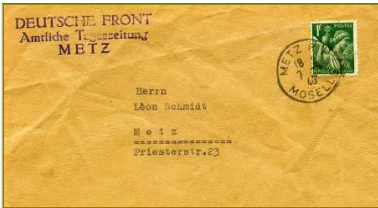
Lettre locale de Metz du 7 août au port de la lettre du 1 er échelon du tarif français.

Pendant les trois jours, 21, 22 et 23 août, où existait la possibilité d'affranchissements mixtes, c'est le tarif allemand qui était appliqué avec conversion du franc en pfennigs, sur la parité de 1 franc correspondant à 5 pfennigs. Mais, pendant ces trois jours de tolérance, nous avons rencontré quelques rares lettres affranchies en timbres français au tarif français.