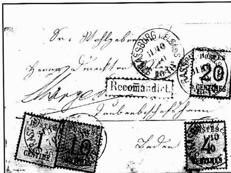
31.10.1870 : lettre recommandée de STRASBOURG pour TAUBERBISCHOFSHHEIM, affranchie à 35 centimes.